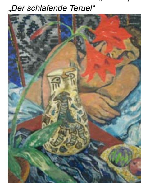
„Der schlafende Teruel“

In diesem Jahr findet in der GALERIE REMISE eine Gedächtnisausstellung anlässlich des 125-jährigen Geburtstages des Künstlers statt, die während der Zeit der Landesgartenschau vom 1.5. bis 29.8.2010 jeweils an den Wochenenden Samstag und Sonntag von 11 – 19 Uhr geöffnet ist.